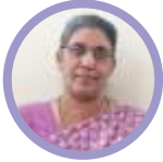
Maryland Francis St. Peter's Church, Salpur

രക്ഷാകരപദ്ധതിയിൽ സുപ്രധാനമായ പങ്കുവഹിച്ച പരിശുദ്ധ അമ്മയുടെ ജനനത്തിനുമുമ്പ് ആഘോഷിക്കുന്ന ഒരുക്കത്തിലാണ് നാമോരോരുത്തരും. പലരും വിമലഹൃദയ പ്രതിഷ്ഠ നടത്തി പരി. അമ്മയുടെ സ്നേഹകാപ്പയ്ക്കുള്ളിൽ അഭയം തേടി സ്വർഗ്ഗം ലക്ഷ്യമാക്കി ജീവിക്കുന്നവരാണ്. കുഞ്ഞുനാൾ മുതൽ എന്നെ ക്രൈസ്തവവിശ്വാസത്തിലൂടെ നയിക്കുകയും പരി. അമ്മയുടെ അതിരില്ലാത്ത മാതൃ പരിലാളനയെക്കുറിച്ച് എനിക്ക് വിശദീകരിച്ചു തന്ന് അതിലൂടെ സ്വർഗ്ഗീയ പിതാവിന്റെ സ്നേഹത്തിൽ പങ്കുചേരാൻ കഴിയുമെന്നും എന്നെ പഠിപ്പിച്ചത് എന്റെ അപ്പച്ചന്റെ അമ്മ (അമ്മമ്മ) ആയിരുന്നു. അഞ്ചാം ക്ലാസിൽ പഠിക്കുമ്പോൾ വീട്ടിലെ ഉയരമുള്ള ഗോവണിയിൽ നിന്നും നിലംപതിച്ചപ്പോൾ ഓടി വന്ന അമ്മമ്മ പറഞ്ഞത് “മാതാവ് എന്റെ മോളെ കാത്തു” എന്നായിരുന്നു. ആ വാക്കുകൾ ഇന്നും ഒരു സാക്ഷ്യം പോലെ എന്റെ ഓർമ്മയിൽ തിളങ്ങുന്നു. അന്നെനിക്ക് ഒരു പോറ്റൽ പോലും ഏൽക്കാതിരുന്നത് എല്ലാവർക്കും അത്ഭുതമായിരുന്നു. അമ്മമ്മയുടെ പരി. മാതാവിനോടുള്ള ആഴമേറിയ വിശ്വാസവും മൂടങ്ങാതെയുള്ള പ്രാർത്ഥനകളും ചെറുപ്പം മുതൽ തന്നെ അടുത്തു നിന്ന് അനുഭവിച്ചറിയാൻ കഴിഞ്ഞിരുന്ന എനിക്കും പരി. അമ്മയുടെ വാൽസല്യത്തെ ജപമാലമണികളിലൂടെ അറിയുവാൻ കഴിഞ്ഞിരുന്നു. വിവാഹശേഷം നാസിക്കിൽ എത്തിയപ്പോഴും അപരിചിതമായ ചുറ്റുപാടുകളിൽ പരി. അമ്മയുടെ മാദ്ധ്യസ്ഥം തന്നെയായിരുന്നു വലിയൊരു താങ്ങും തണലും. എന്റെ Delivery സമയത്ത് ഒരു ഹൈന്ദവഹോസ്പിറ്റലിൽ ആയിരുന്നിട്ടുപോലും Mary എന്ന് പേരുള്ള ഒരു നഴ്സ് വന്ന് “മാതാവിനോടു പ്രാർത്ഥിച്ചോളൂ. സുഖപ്രസവം നടക്കും” എന്ന് പറഞ്ഞതും ഒരു ബുദ്ധിമുട്ടില്ലാതെ Normal Delivery നടന്നതും പരി. അമ്മയുടെ പ്രത്യേക സംരക്ഷണ യിലായിരുന്നെന്ന് ഞാൻ ഉറച്ചു വിശ്വസിക്കുകയാണ്.