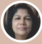
Swapna Jose St. Thomas Church, Dapodi

സ്ത്രീത്വവും മാതൃത്വവും വിലകുറഞ്ഞതായി കരുതപ്പെടുന്ന ഈ ആധുനികലോകത്തിൽ മാതൃത്വം ശ്രേഷ്ഠമാണെന്നും സ്ത്രീത്വം വിലയുറ്റതാണെന്നും മനസ്സിലാക്കുന്നതിന് പരിശുദ്ധ അമ്മയുടെ പക്കലേക്കു തിരിയാം. നമ്മുടെ മാതൃത്വത്തെ, അമൂല്യമാക്കാൻ, ഒരു നല്ല അമ്മയാകാൻ, നമുക്ക് എങ്ങനെ സാധിക്കും? വേറെങ്ങും പോകേണ്ട, പരിശുദ്ധ അമ്മയുടെ പക്കലേക്കു ചെല്ലാം. എന്തെന്നാൽ നമ്മിലൊരുവളായിരുന്നിട്ടും അവൾ മാതൃത്വത്തിന്റെ, പൂർണതയിലേക്ക് ഉയർത്തപ്പെട്ടവളാണ്. ഒരു സാധാരണ യഹൂദ സ്ത്രീ എങ്ങനെയാണ് സാർവലൗകികമായി പരിപൂർണ്ണമായ മാതൃത്വം എന്ന ശാശ്വത പദവിയാൽ സമ്മാനിതയായത്? ഉത്തരമിതാണ്: “മിശിഹായെ ഗർഭം ധരിച്ച്, ജനിപ്പിച്ച്, പോറ്റി വളർത്തി പിതാവിന്റെ ആലയത്തിൽ സമർപ്പിച്ച് കുരിശിൽ മരിക്കുന്ന തന്റെ പുത്രനോടൊത്ത് പീഡയനുഭവിച്ച്, അനുസരണം, വിശ്വാസം, പ്രത്യാശ, ഉജ്ജ്വല സ്നേഹം എന്നിവ വഴി ആത്മാക്കളുടെ പ്രകൃത്യതീത ജീവൻ പുനരുദ്ധരിക്കാൻ വേണ്ടി രക്ഷകന്റെ പ്രവൃത്തിയോട് സർവദാ സവിശേഷമായ വിധം സഹകരിച്ചു. ഇക്കാരണത്താൽ, പ്രസാദ വരമണ്ഡലത്തിൽ നമ്മുടെ അമ്മയായി അവൾ പരിലസിക്കുന്നു” (തിരുസഭ : 61).