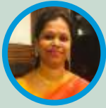
Somini Winson Holy Trinity Church, Thane