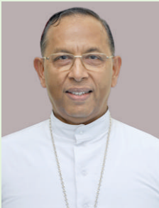
മാർ തോമസ് തുലവനാൽ കല്യാൺ രൂപതയുടെ മെത്രാൻ