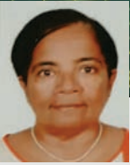
Rosy Stanley St. Mary's Church, Belapur

നമ്മൾ എന്തിനെ ഭയപ്പെടുന്നുവോ അവയെ അഭിമുഖീകരിച്ച് അതിജീവിക്കുന്നതാണല്ലോ challenge എന്ന പദം കൊണ്ടു വിവക്ഷിക്കുന്നത്.